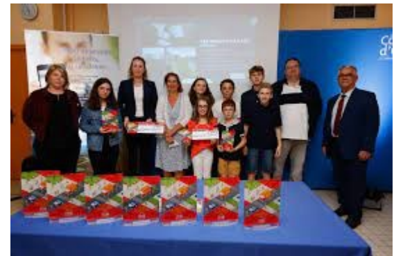
Prix Myon remis au Collège Les Hautes Pailles par le Conseil départemental au Collège Champollion